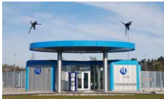
Hydrogenstasjon. Herøya, StatoilHydro