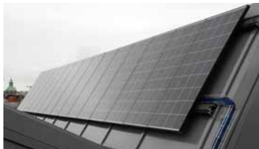
Kunstinstallasjon. Stavanger Aftenblad