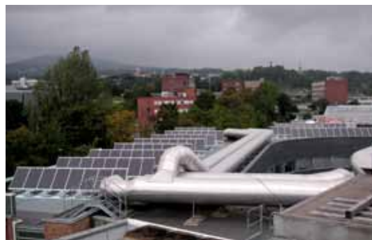
Nett-tilknyttet solcelleanlegg. Forskningsparken