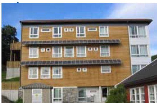
Nett-tilknyttet solcelleanlegg. Vestagderklinikken