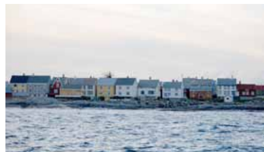
Brannovervåking. Grip, Kristiansund kommune