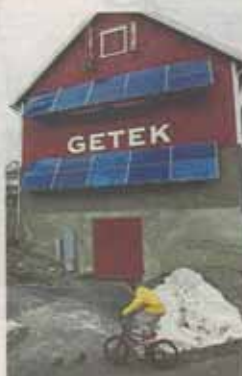
Energifjøs: I fjøset på gården utvikles energiløsninger.